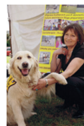
Marta Kubišová čestná členka správní rady